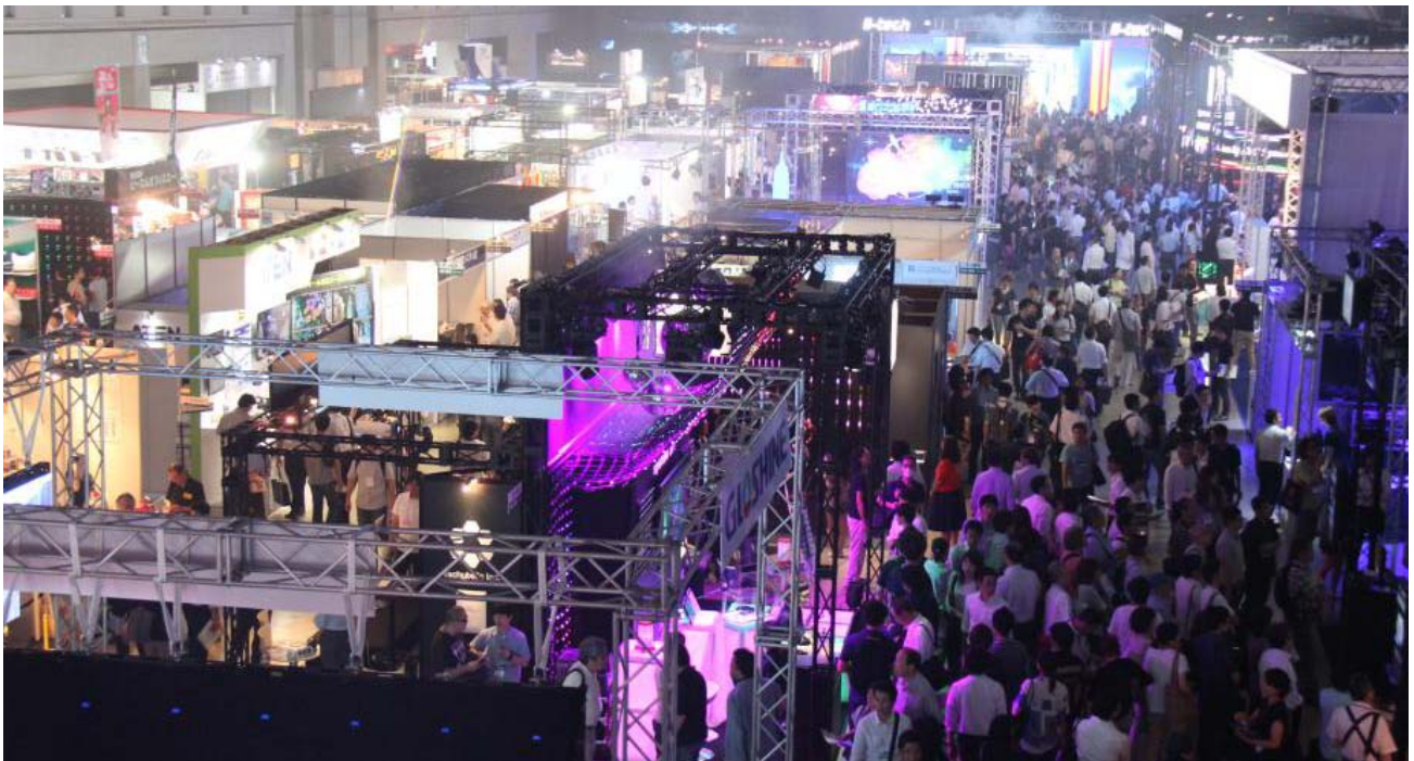
（前回 2014 年会場風景）

7月・8月にかけて、夏フェスやイベントが日本各地で開催されます。そこは、ステージ一面に広がる巨大スクリーン、キラキラ光る LED ライトから、空腹を満たしてくれるフード、Tシャツなどのグッズまで、様々な機器・サービスが来場する人を楽しませるために関わっています。来る 2015 年 7 月 8 日[水]～10 日[金]、幕張メッセにて、第 2 回 ライブ&イベント産業展が開催されます。（主催：リード エグジビション ジャパン（株））本展には、そんなライブ&イベントを支える機材・機器、ライブ配信技術から、会場・施設、グッズ、各種サービス 400社 * が一堂に出展します。展示される製品・技術・サービスが今年の夏を彩ることになるかもしれません。ぜひ、取材のためにお越しください！